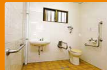
Accessible Toilet. 車いす対応のトイレ

Wheelchair ramp at the facility entrance 施設入り口にスロープ